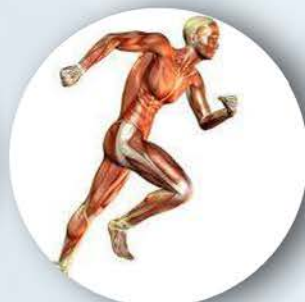
Il Report Fitness Scientifico