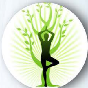
Il Report Salute e Benessere