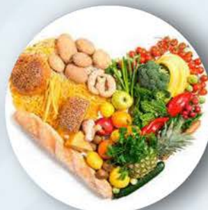
Il Report Nutrigenomico