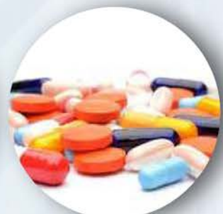
Il Report Farmacogenomico